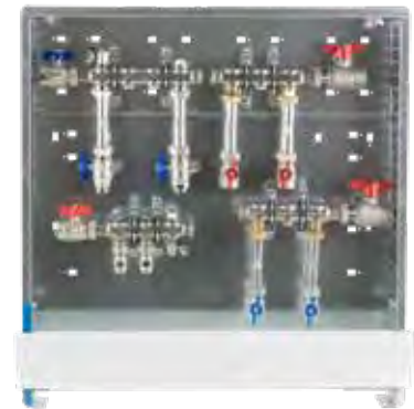
Abb. WA2/W4 - WMZ

Comfort UP-Schrank C69 mit weißer (RAL 9016) Frontblende, verzinkte Einbauzarge 110-150 mm