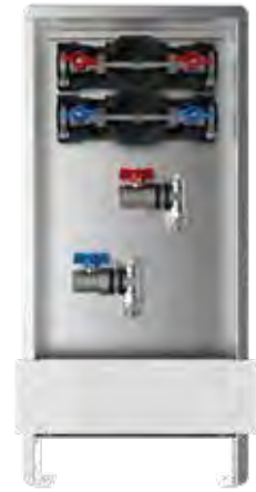
Abb. AS 11h W2 ST

Primärseite: Anschluss horizontal mit Kugelhahn ¾" IG im Vor- und Rücklauf Sekundärseite: Anschluss vertikal ¾" AG mit Konus, passend für Klemmschraubungen im Vor- und Rücklauf Wasserzählereinbaustrecken: W1= Wasserzählereinbaustrecke KW mit DVGW-Kugelhahn ¾" und EPP-Wärmedämmung W2= Wasserzählereinbaustrecken KW + WW mit DVGW-Kugelhahn ¾" und EPP-Wärmedämmung Schrank: UP-Wandschrank 84/85, Einbautiefe 90-120 mm UP-Standschrank 80, Einbautiefe 90-120 mm AP-Schrank, Bautiefe 125 mm