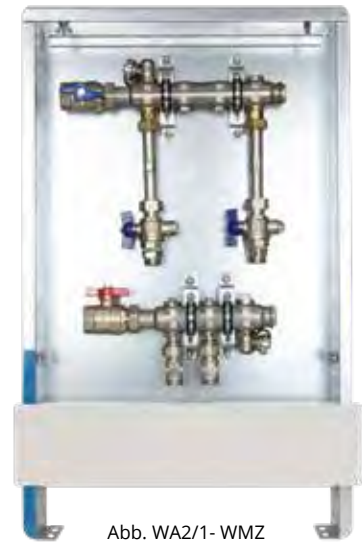
Abb. WA2/1- WMZ