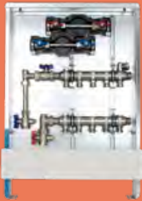
6.1.3 Anschlussstation H 52 im Aufputzschrank A Einbauhöhe von OK FFB 610 mm Bautiefe 125 mm