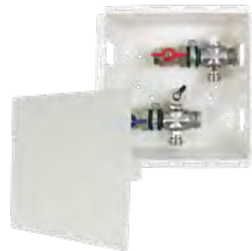
Abb. AS 11h mini LIM

Anschluss vertikal \frac{3}{4} " AG mit Konus, passend für Klemmverschraubungen im Vor- und Rücklauf