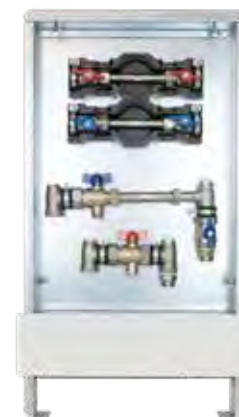
Abb. AS 14 W2-WMZ ST