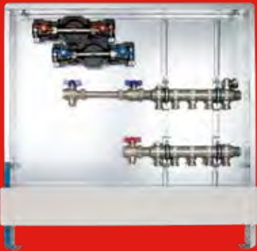
6.1.2 Anschlussstation H 52 im Unterputzschrank 69 Einbauhöhe von OK FFB 640 mm Einbautiefe 110-150 mm