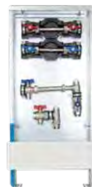
Abb. AS 13h-W2-WMZ ST

UP-Standschrank 80, Einbautiefe 90-120 mm