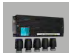
strawalogix RT-STA 230 V und strawatherm 230 V + Vorverdrahtung