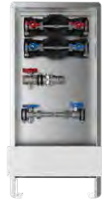
Abb. AS 12h-W2-WMZ-ST

Sekundärseite: Anschluss horizontal mit ¾" IG im Vor- und Rücklauf Wasserzählereinbaustrecken: W1= Wasserzählereinbaustrecke KW mit DVGW-Kugelhahn und EPP-Wärmedämmung W2= Wasserzählereinbaustrecken KW + WW mit DVGW-Kugelhahn und EPP-Wärmedämmung Schrank: UP-Wandschrank 84/85, Einbautiefe 90-120 mm UP-Standschrank 80, Einbautiefe 90-120 mm