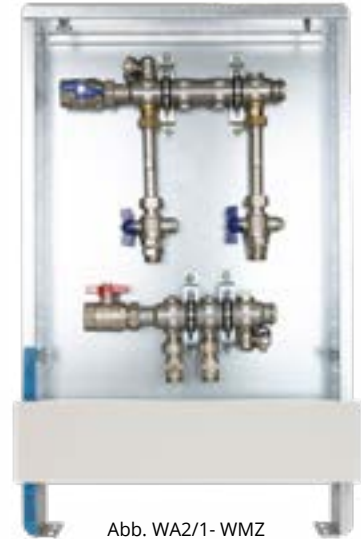
Abb. WA2/1 - WMZ