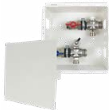
Abb. AS 11h mini LIM

Anschluss vertikal \frac{3}{4} " AG mit Konus, passend für Klemmverschraubungen im Vor- und Rücklauf