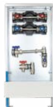
Abb. AS 13h-W2-WMZ ST

UP-Standschrank 80, Einbautiefe 90-120 mm