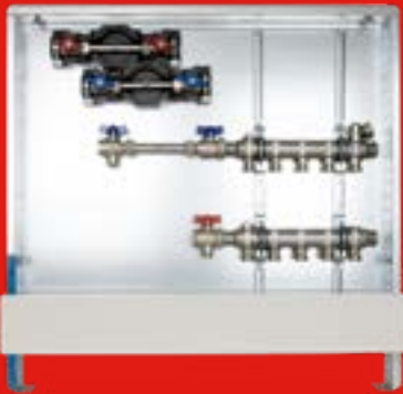
6.1.2 Anschlussstation H 52 im Unterputzschrank 69 Einbauhöhe von OK FFB 640 mm Einbautiefe 110-150 mm