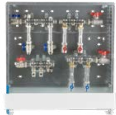
Abb. WA2/W4 - WMZ

Comfort UP-Schrank C69 mit weißer (RAL 9016) Frontblende, verzinkte Einbauzarge 110-150 mm