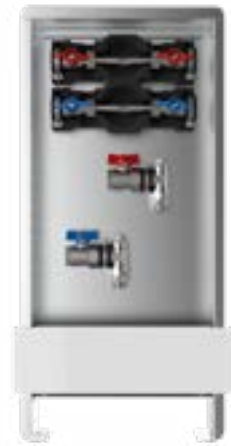
Abb. AS 11h W2 ST

Primärseite: Anschluss horizontal mit Kugelhahn 3/4" IG im Vor- und Rücklauf Sekundärseite: Anschluss vertikal 3/4" AG mit Konus, passend für Klemmverschraubungen im Vor- und Rücklauf Wasserzählereinsteckbaustrecken: W1= Wasserzählereinsteckbaustrecke KW mit DVGW-Kugelhahn 3/4" und EPP-Wärmedämmung W2= Wasserzählereinsteckbaustrecken KW + WW mit DVGW-Kugelhahn 3/4" und EPP-Wärmedämmung Schrank: UP-Wandschrank 84/85, Einbautiefe 90-120 mm UP-Standschrank 80, Einbautiefe 90-120 mm AP-Schrank, Bautiefe 125 mm