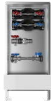
Abb. AS 12h-W2-WMZ-ST

Sekundärseite: Anschluss horizontal mit 3/4" IG im Vor- und Rücklauf Wasserzählereinsteckbaustrecken: W1= Wasserzählereinsteckbaustrecke KW mit DVGW-Kugelhahn und EPP-Wärmedämmung W2= Wasserzählereinsteckbaustrecken KW + WW mit DVGW-Kugelhahn und EPP-Wärmedämmung Schrank: UP-Wandschrank 84/85, Einbautiefe 90-120 mm UP-Standschrank 80, Einbautiefe 90-120 mm