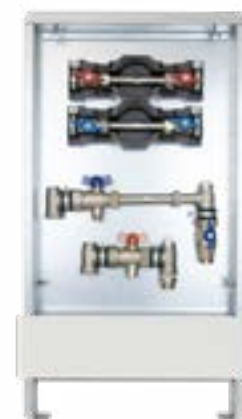
Abb. AS 14 W2-WMZ ST