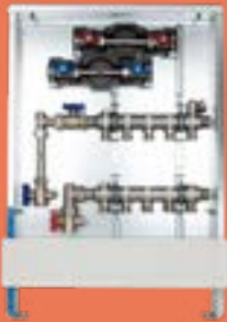
6.1.3 Anschlussstation H 52 im Aufputzschrank A Einbauhöhe von OK FFB 610 mm Bautiefe 125 mm