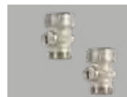
Mini Kugelhahn-Set zur Primärabspernung von FBR-FBM 130/4