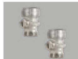
Mini Kugelhahn-Set zur Primärabsperrung von FBR-FBM 130/4